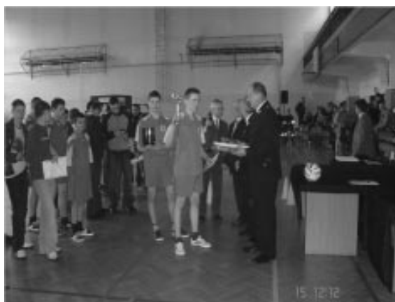
Powiatowy Konkurs z Wiedzy Pożarniczej