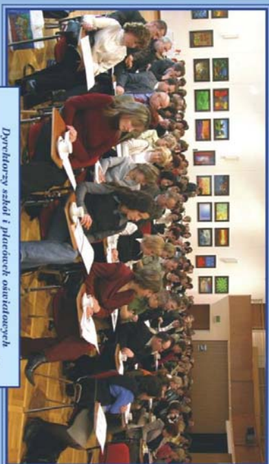
Dyrektorzy szkół i placówek oświatowych oraz dyrektorzy i kierownicy oświaty w gminach i powiatach Małopolski i Podkarpatia uczestniczą w konferencji poświęconej przygotowaniu do pracy z Systemem Informacji Oświatowej