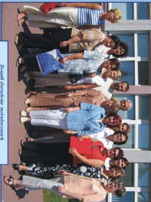
Zespół doradcze młodzieżowych Samorządowego Centrum Edukacji w Tarnobrzegu