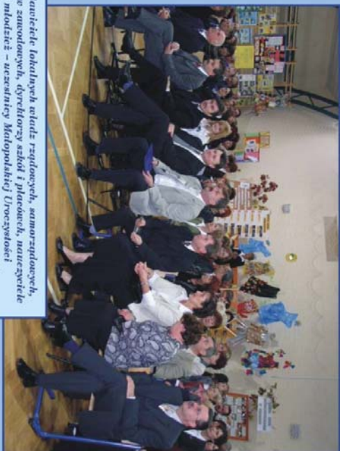
Przedstawiciele lokalnych władz rządowych, samorządowych, związków zawodowych, dyrektorzy szkół i placówek, naukowcy i młodzież – uczestnicy Inauguracji Centrum Promocji Przedsiębiorczości Nadania Certyfikatu Szkoła Promującym Zdrowie podjętoj z Powiatowym Biurem Komisji Edukacji Narodowej